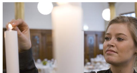
Webinar med Folkekirkens Grønne Omstilling